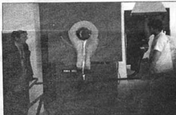
Λιώσιμο του μετάλλου

νιρώνονται ποσότητες άχρηστων μετάλλων και μετά από διαλογή προωθούνται στην Αθήνα προκειμένου εκεί να γίνει η επεξεργασία, έτσι ώστε το παλιό και άχρηστο υλικό να μετατραπεί σε πρώτη ύλη για νέες κατασκευές. Το 1998 οι τέσσερις συνεταιίροι υποβάλλουν φάκελο στο Ευρωπαϊκό Πρόγραμμα Leader μέσω της ΕΤΑΔ, προκειμένου η μικρή τότε επιχείρηση συγκεντρώσεως ανακυκλώσιμου υλικού να εμποδοθεί και να αποκτήσει εξοπλισμό, έτσι ώστε να αποκτήσει τη δυνατότητα ανακύκλωσης μεγάλων ποσοτήτων μετάλλου στις εγκαταστάσεις της. Η πρόταση των επιχειρηματιών κρίνεται ενδιαφέρουσα από την ΕΤΑΔ και έτσι μέσα σε λίγους μήνες ο φάκελος εγκρίνεται και ξεκινά η επίκεντρα των εγκαταστάσεων και ο εκσυγχρονισμός του εξοπλισμού. Μέσα στο 2002 το "Χυτήριο Λέσβου" λειτουργού πλέον με τη σημερινή του μορφή με δυναμικότητα ανα-